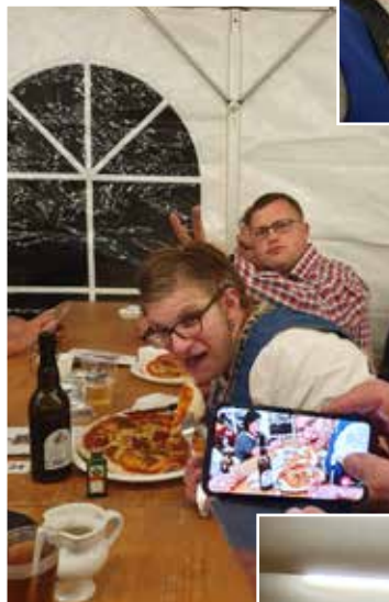
Ehrungen Gemeinde Wangen